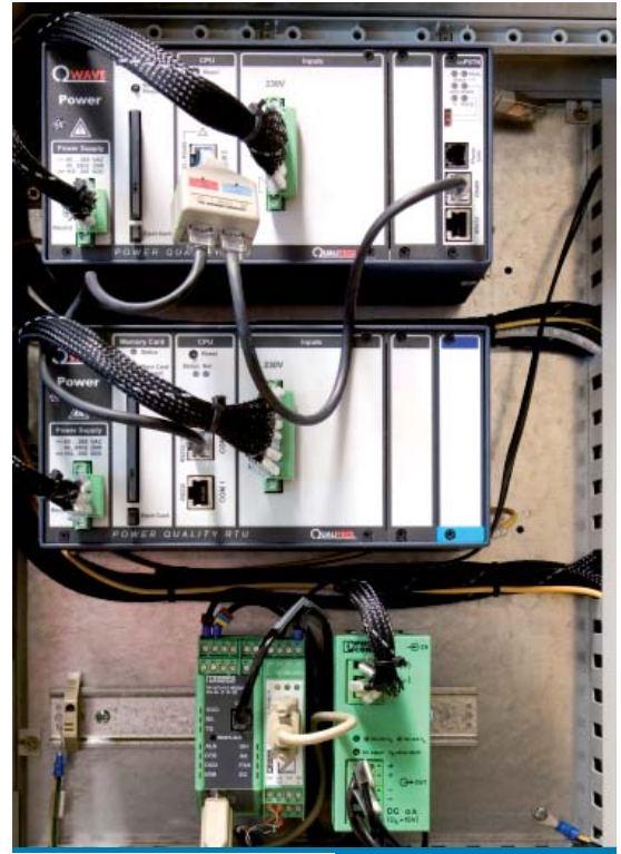
Laborelec gebruikt voor zijn mobiele meetposten GSM/GPRS-modems.

de kwaliteit van de netspanning meten en registreren. Ze meten twee types van gegevens: enerzijds de permanente registratie van kwaliteitsparameters – het spanningsniveau, snelle variaties in de spanning, de harmonische vervorming enzovoort – en anderzijds events zoals korte of lange onderbrekingen, overspanningen en vooral spanningsdips: korte spanningsdalingen die voornamelijk veroorzaakt worden door elektrische fouten in het net."