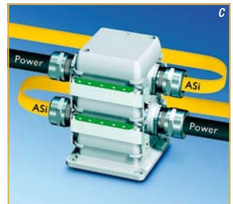
Afbeelding 2. De stapelbehuizing maakt verschillende kabelgeleidingen mogelijk: één kabel per stapelbehuizing (a), dunne power- en 24 V-kabels in één behuizing (b) en twee ingangen per behuizing (c).